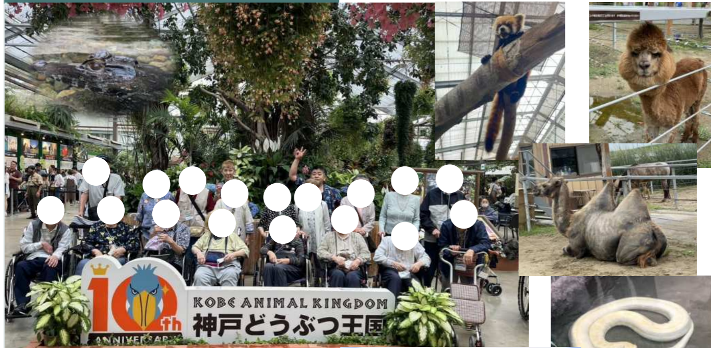
利用者様からの感想文