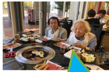
バーベキュー楽しいね！