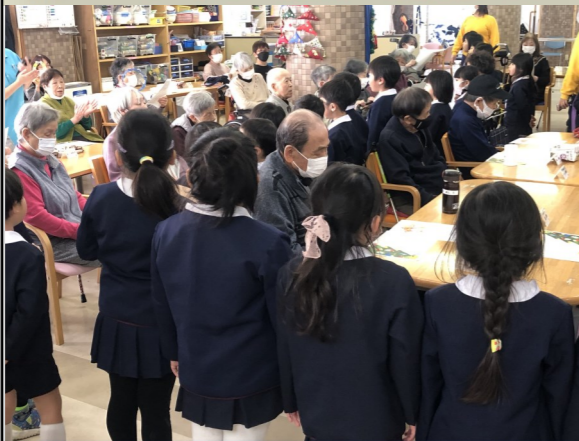
園児たちから「ジングルベル」と「赤鼻のトナカイ」の歌のプレゼント!!