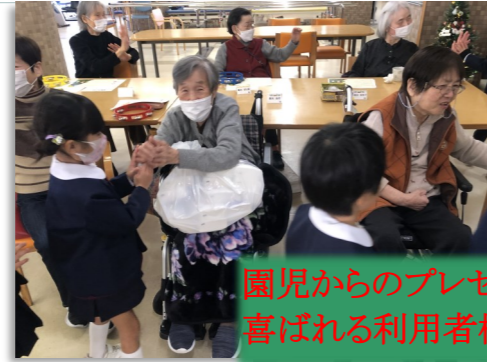
園児からのプレゼントに喜ばれる利用者様

昨年12/18、佃幼稚園児とクリスマス会を開きました。各フロアと通所リハに「ジングルベル」「赤鼻のトナカイ」の歌とメッセージ入りの飾り絵をプレゼントしてくれました。利用者様もクリスマス衣装で園児を迎え入れられ、大いに盛り上がりました。