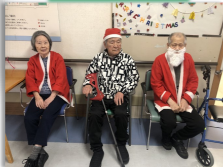
利用者様もクリスマス衣装に変身!